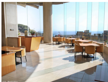
ロビー・ラウンジ