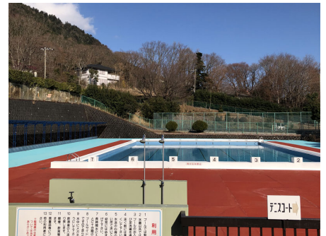
別荘地内施設 屋外プール