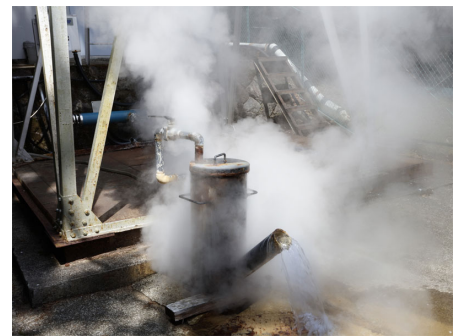
熱川温泉 引き込み可