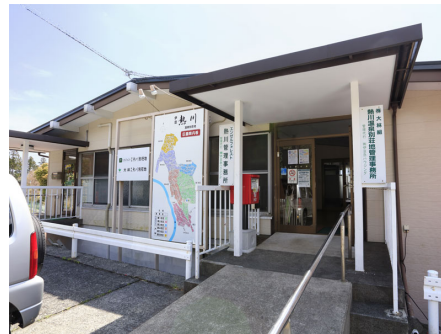
カスタマーセンター入口