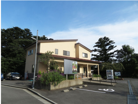
カスタマーセンター

明るい陽射し、そして美しい東伊豆の海岸線、太平洋に浮かぶ大島・利島・式根島などを周囲に配した別荘地、それが赤沢望洋台です。緑の自然に囲まれた別荘地は野鳥のさえずりから朝が始まります。都会の喧騒から逃れ清涼な気候の中で、自然との付き合いがどれほど素晴らしいかを感じさせます。雄大な自然に懐かれて、四季折々の変化が贅沢にお楽しみいただけます。