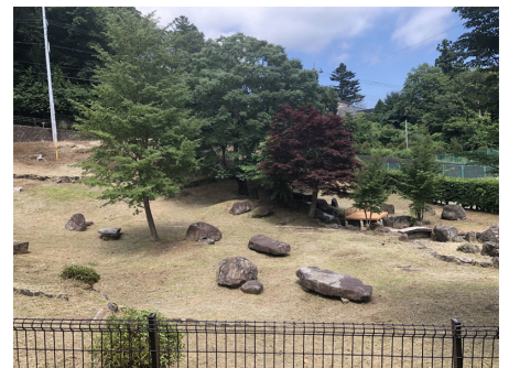
緑の多いドッグランです