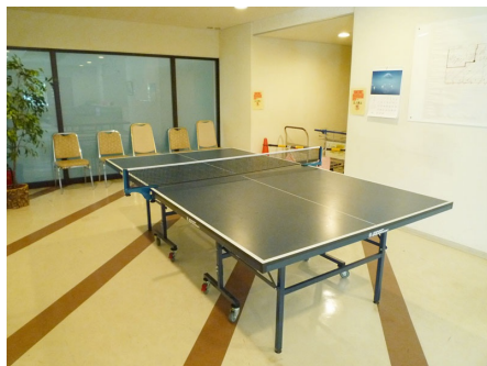
卓球台 (24時間使用可)