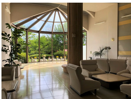
吹き抜けのラウンジ