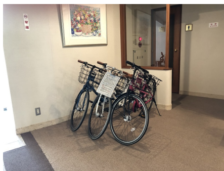
レンタルサイクル