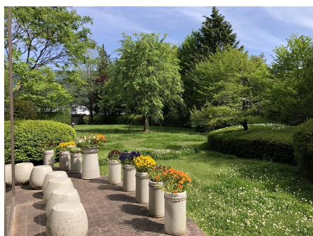
マンション敷地内