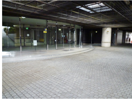
マンション入口 エントランス