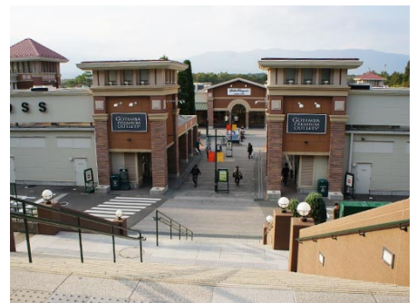
御殿場プレミアムアウトレット