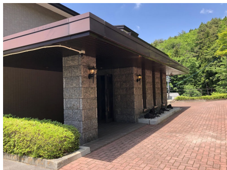
エントランス付近