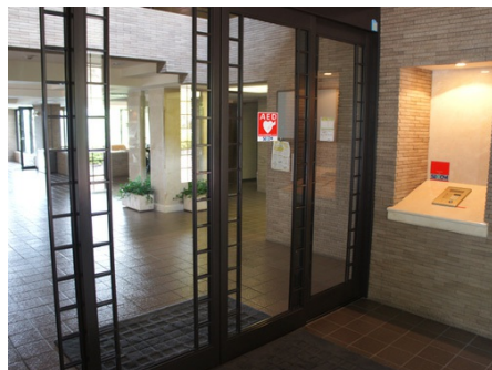
入口・オートロック