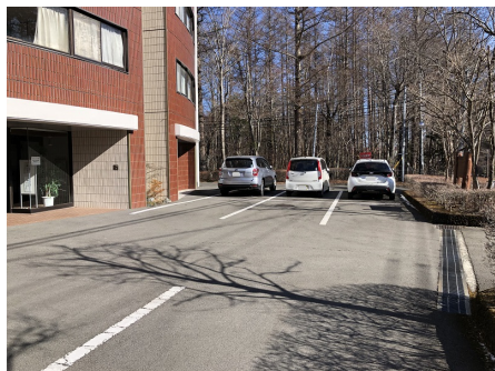
マンション前 駐車スペース