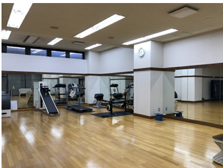
フィットネスルーム (更衣室付き)