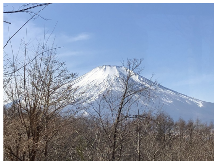
A棟とB棟の連絡通路からの眺望