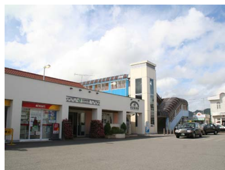
JR外房線安房鴨川駅(徒歩約9分)