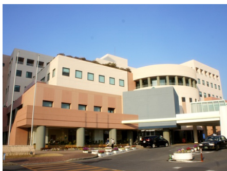
亀田クリニック (車で約7分)