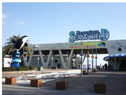
鴨川シーワールド(車で約6分)