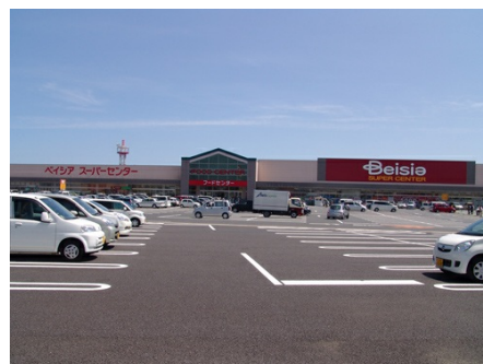
ベイシア鴨川店(車で約5分)