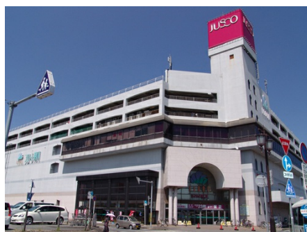
イオン鴨川店(徒歩約12分)