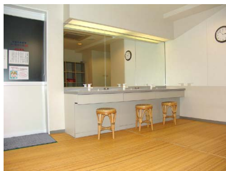
大浴場脱衣所（女湯）