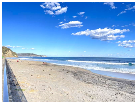
マンション前の部原海岸