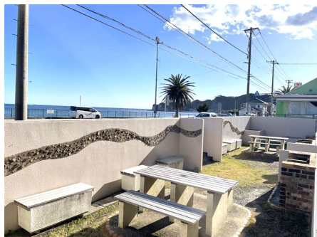
バーベキューコーナー