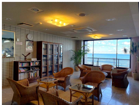
太平洋を臨むロビー