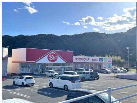
ヤクスドドラッグ勝浦店(車約5分)