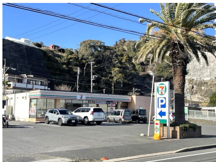
セブンイレブン勝浦ビーチ店(徒歩1分)