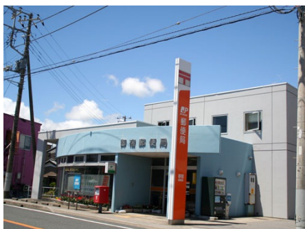
御宿郵便局（徒歩約7分）