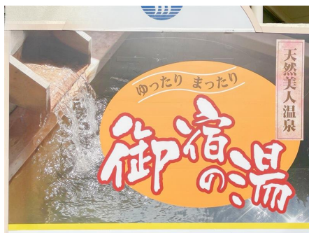
日帰り温泉 御宿の湯 徒歩約2分（クアライフ御宿1階）