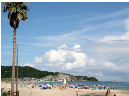
浜海水浴場（徒歩1分）