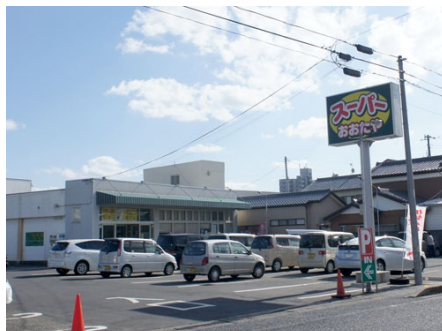
スーパーおたや(徒歩約12分)