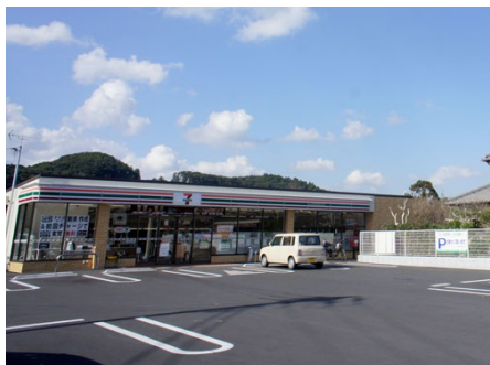
セブンイレブン上総御宿店(徒歩約3分)