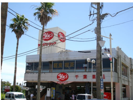
ヤクストック御宿店(徒歩約9分)