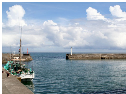
御宿漁港(徒歩約4分)