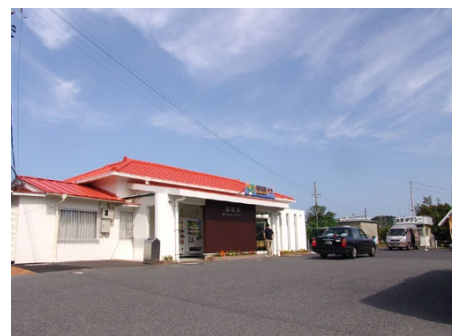
特急列車駅のJR外房線御宿駅 (徒歩約5分)