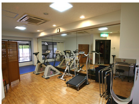
アスレチックルーム