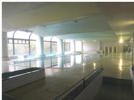
大きな室内プール