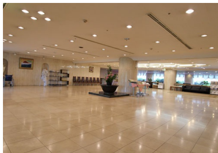
雰囲気の良いエントランス