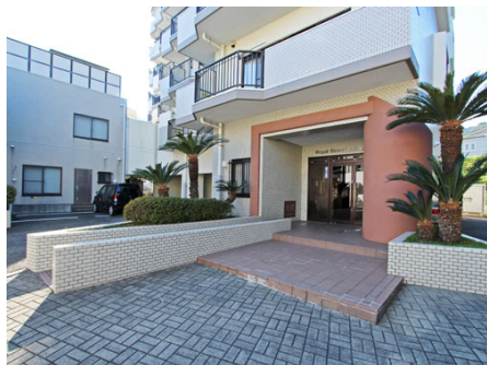
マンション入り口