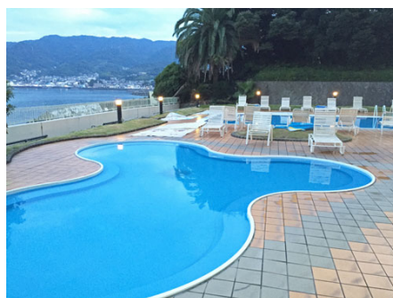
隣接：海風を感じる屋外プール