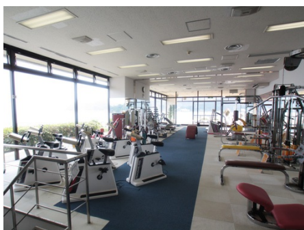
隣接：スポーツルーム