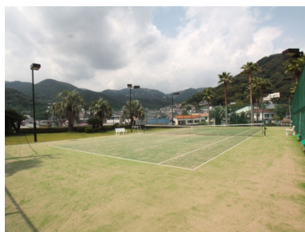
隣接：テニスコート