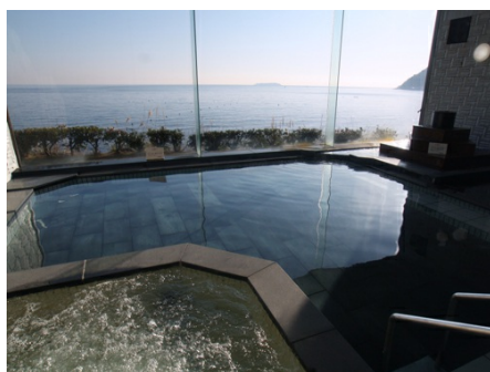
隣接：海目の前の温泉大浴場