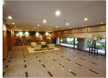
ホテル並みのロビー