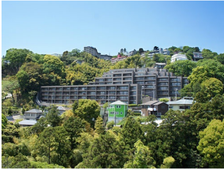
マンション外観 全景