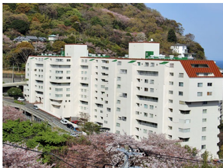
プラザ伊豆山外観