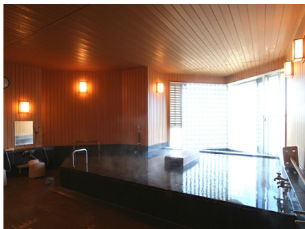
改修された温泉大浴場