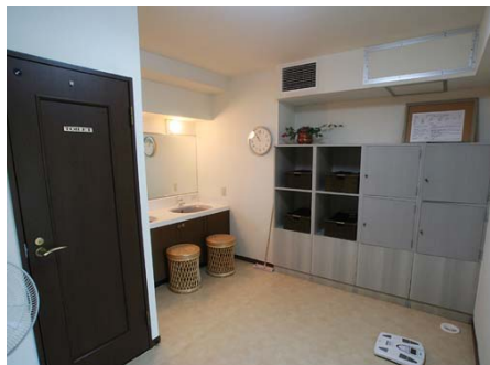
温泉大浴場の脱衣室