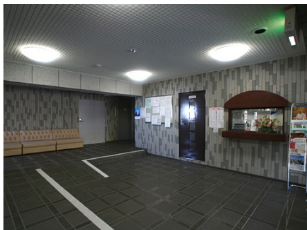
エントランスロビー