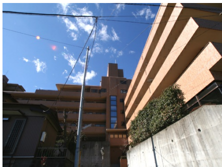
マンション外観 全景