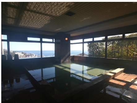
海一望の温泉大浴場（男性）