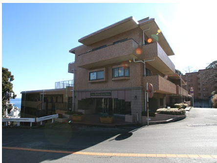
頼朝ライン沿いに立つ