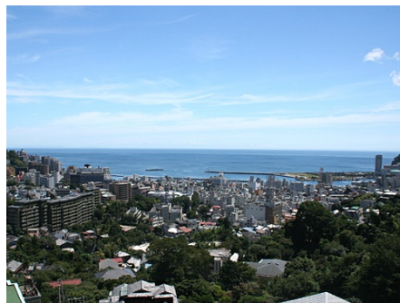
大浴場からの眺望