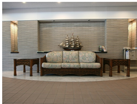
エントランスロビー