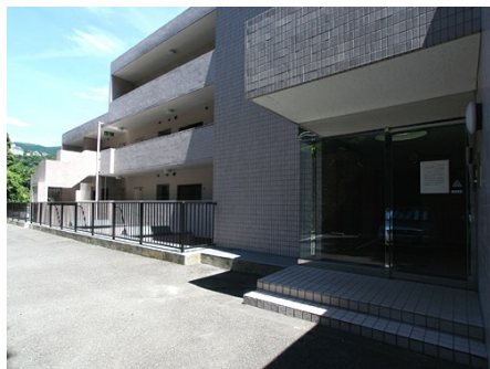
サブエントランス