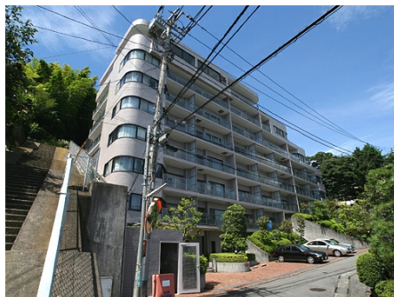
マンション外観 全景