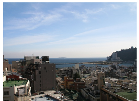
マンションからの眺望（花火大会望む）