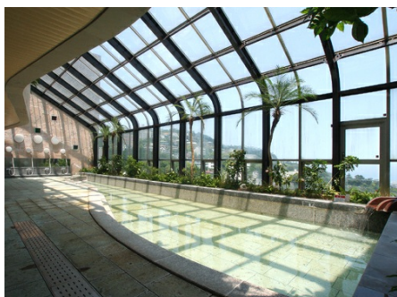
海も望める温泉大浴場