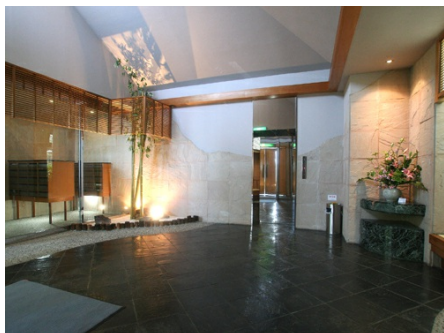
高級感のあるエントランス