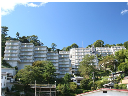
ラ・ヴィ熱海外観