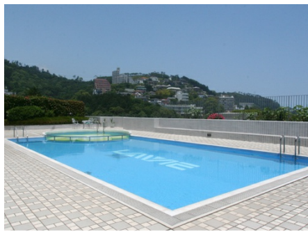
見晴らしの良い屋外プール