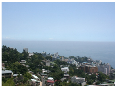
マンションからの眺望