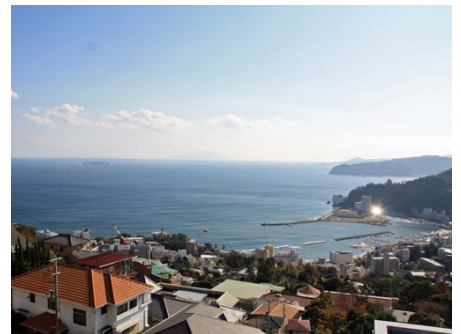
マンションからの眺望