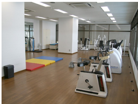
充実したスポーツルーム