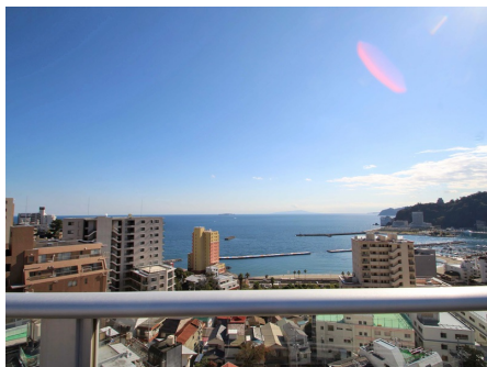
屋上スカイテラスからの眺望1