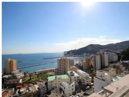
屋上スカイテラスからの眺望3