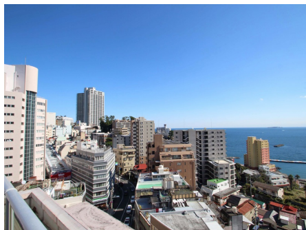
屋上スカイテラスからの眺望2