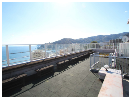
屋上スカイテラス